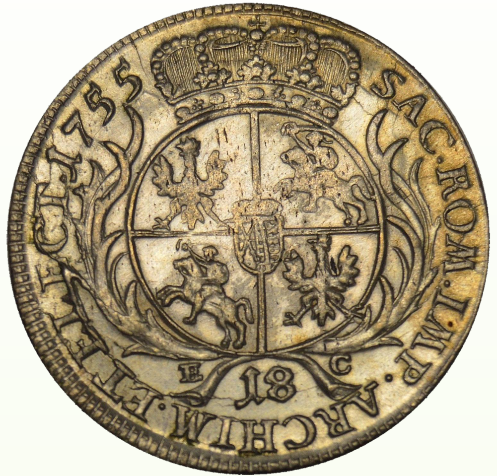
Ort (18 groszy), rok 1755.