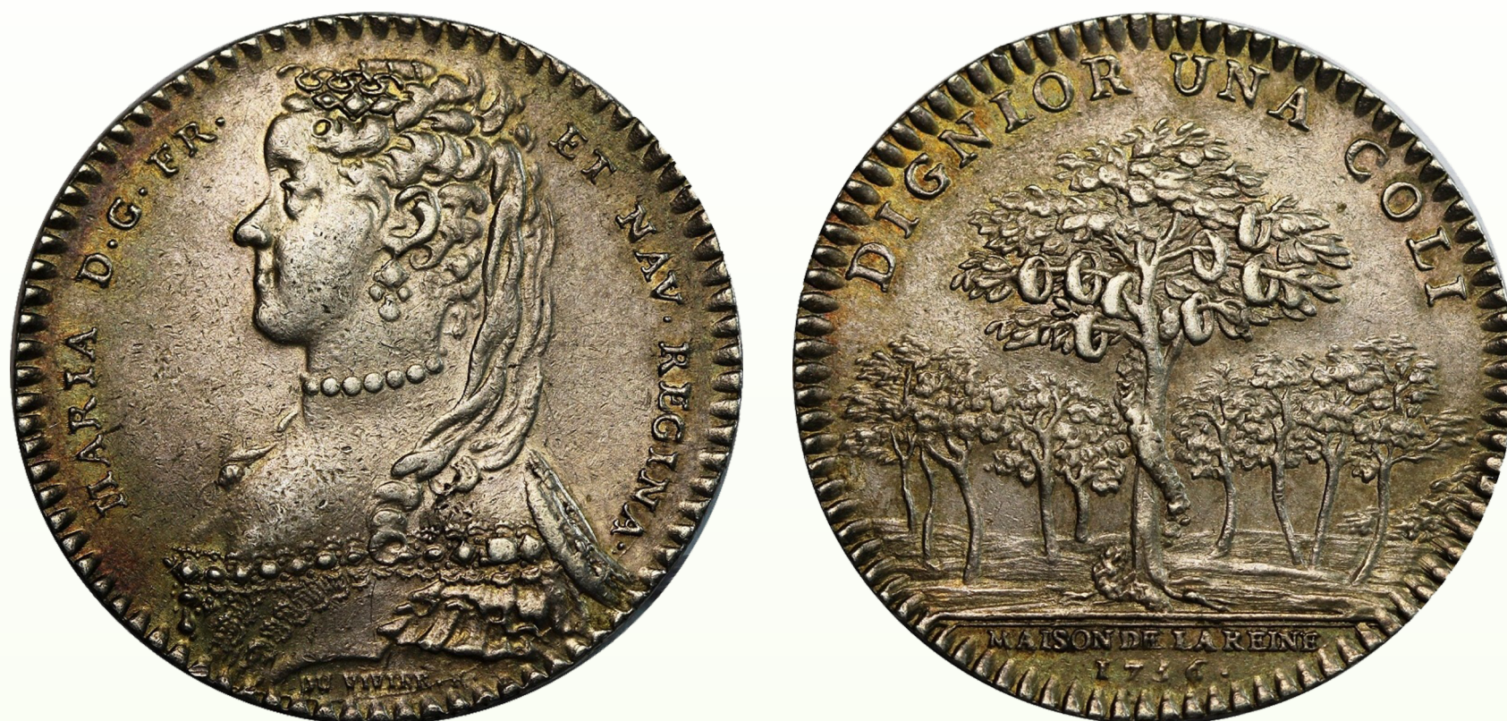
Srebrny żeton z 1756 roku: DIGNIOR UNA COLI.

Żeton z wizerunkiem Marii Karoliny Zofii Felicji Leszczyńskiej (1703-1768), córki Stanisława Leszczyńskiego - króla Polski, królowej Francji - żony Ludwika XVI, matki Ludwika, delfina Francji, który niestety zmarł i nie zdołał wstąpić na tron, babki królów Francji: Ludwika XVI, Ludwika XVIII oraz Karola X.