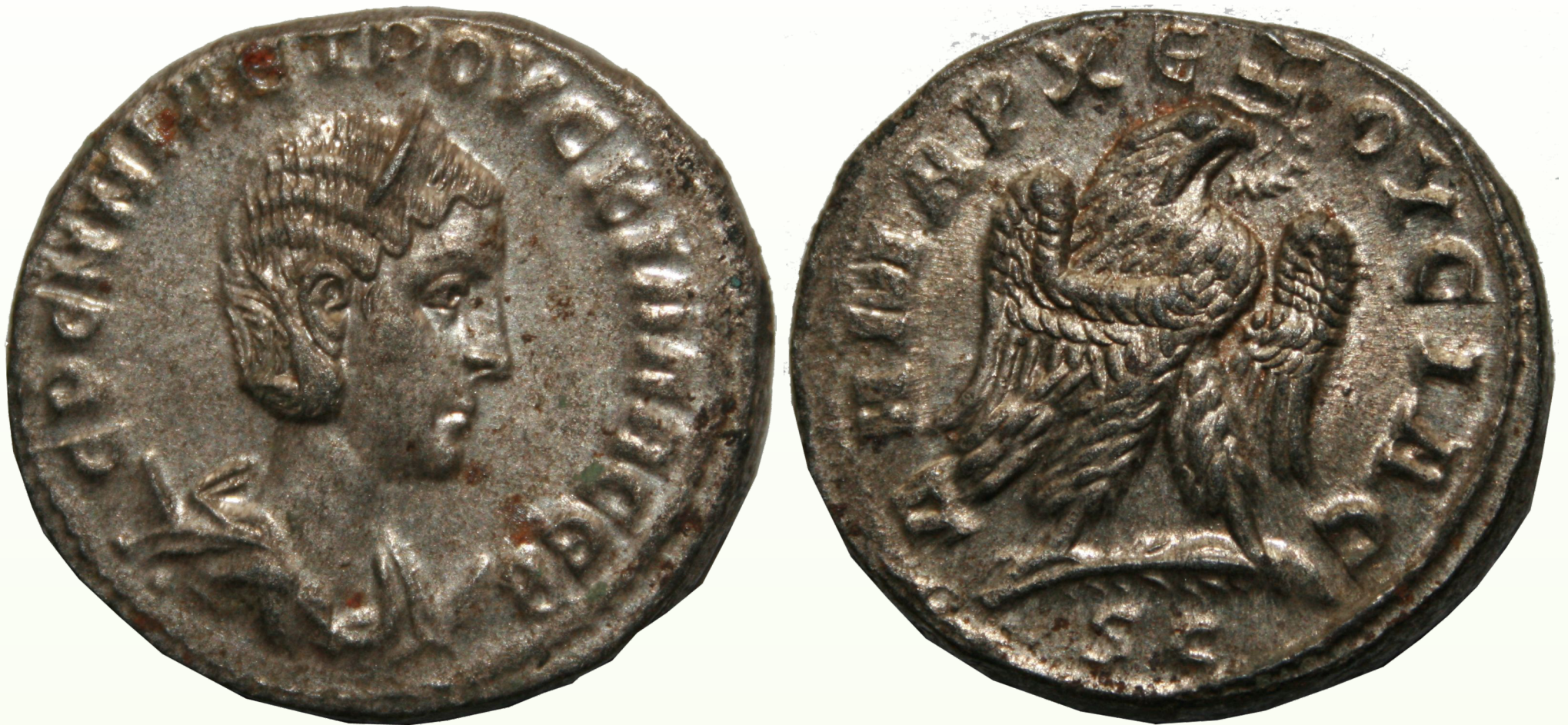
BI tetradrachma, Herennia Etruscilla (żona Trajana Decjusza), Antiochia, Seleucis i Pieria, AD 249-251.

Awers: ΕΡΕΝΝΙΑ ΕΤΡΟΥΣΚΙΛΛΑ ΣΕΒ, Herennia Etruscilla z diademem na głowie i z udrapowanym popiersiem zwrócona w prawo, osadzona na półksiężycu, • • poniżej popiersia z lewej strony.