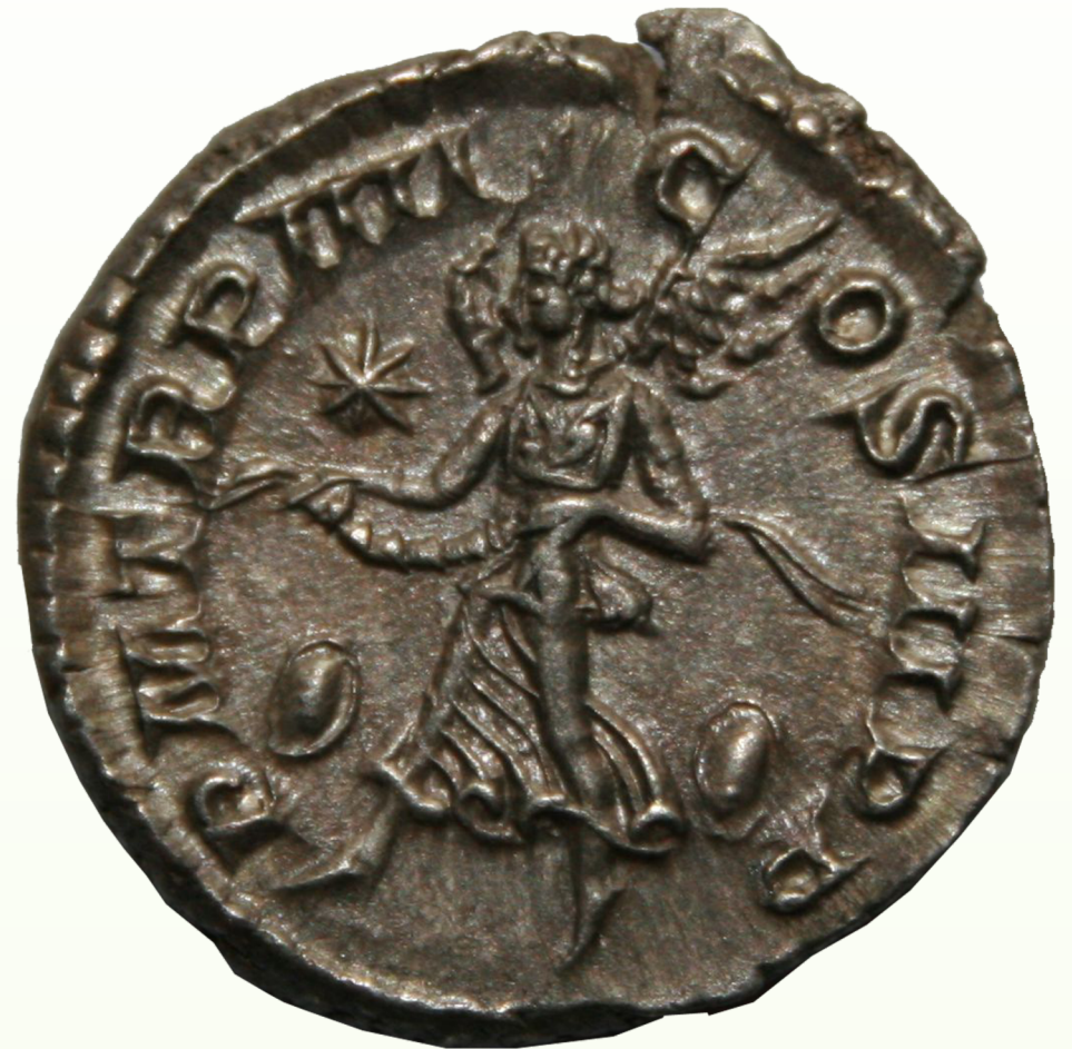
Heliogabal srebrny denar, Rzym AD 221.

Awers: Udrapowane popiersie cesarza Heliogabala, w pancerzu i z wieńcem laurowym na głowie, zwrócone w prawo - napis: IMP ANTONINVS PIVS AVG