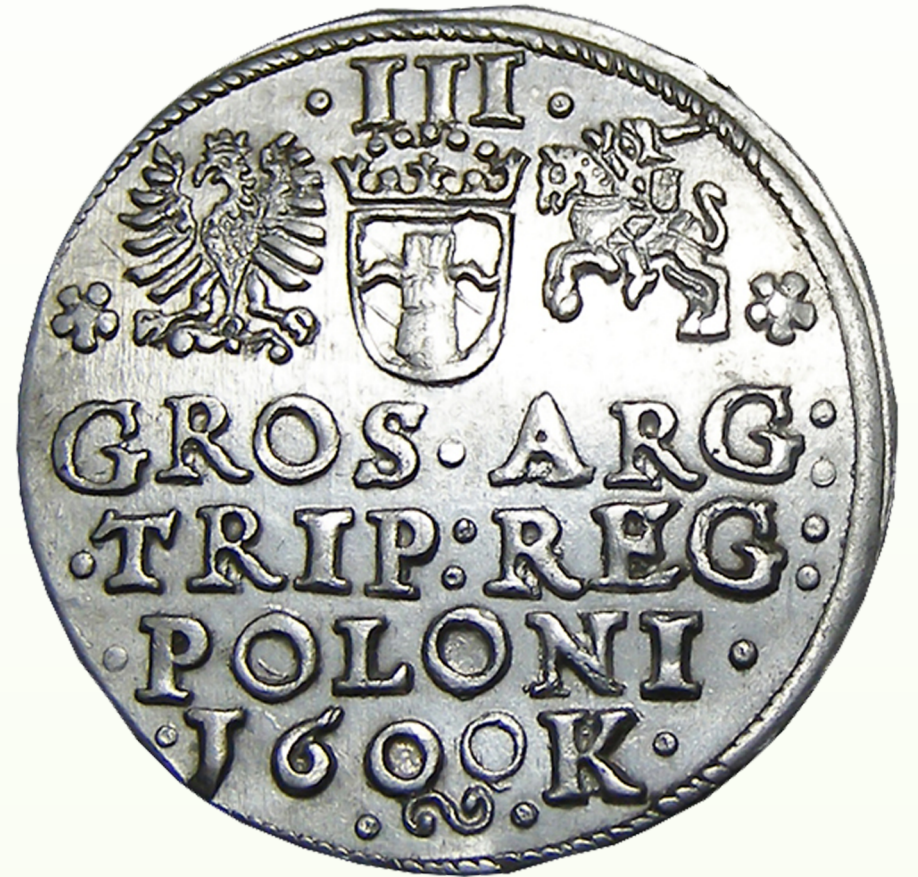
Trojak, Zygmunt III Waza, rok 1600, Kraków.